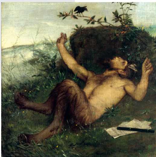
◀ Fauno silbando a un mirlo , obra del artista Arnold Böcklin (1827-1901).

El fauno tiene la parte superior del cuerpo de un hombre y la inferior de un chivo o cabra. Es una figura imaginaria de la mitología romana, que surge de las creencias de pastores y labradores.