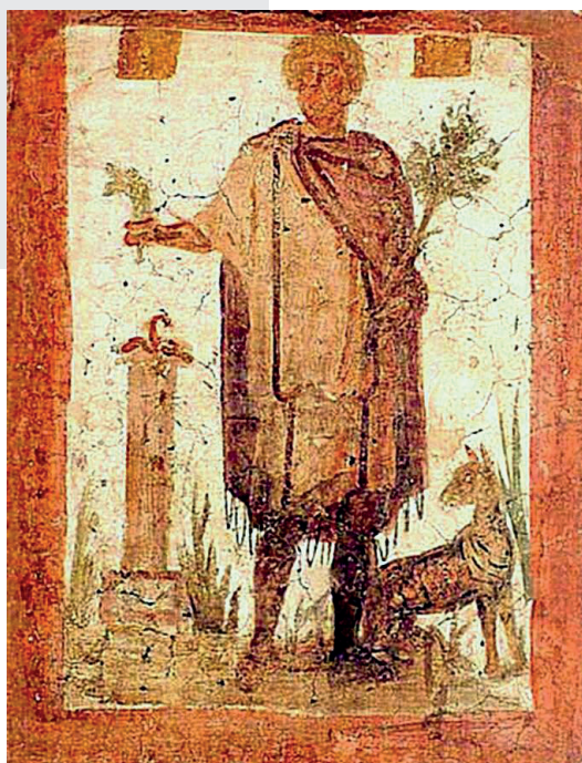
◀ Pintura de Silvano en el Museo de Ostia, antigua ciudad italiana.

Las sirenas son seres que habitan en las aguas de ríos, lagos, mares y océanos. Sus cuerpos tienen forma humana de la cintura hacia arriba y de un pez de la cintura hacia abajo.