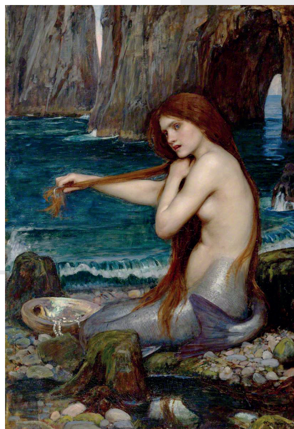
▲ Una sirena , obra del artista John William Waterhouse (1849-1917).

El fauno tiene la parte superior del cuerpo de un hombre y la inferior de un chivo o cabra. Es una figura imaginaria de la mitología romana, que surge de las creencias de pastores y labradores.